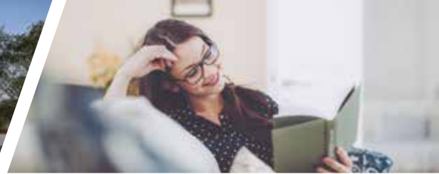
Résidence universitaire et Centre jeunesse Pierre Bérégovoy