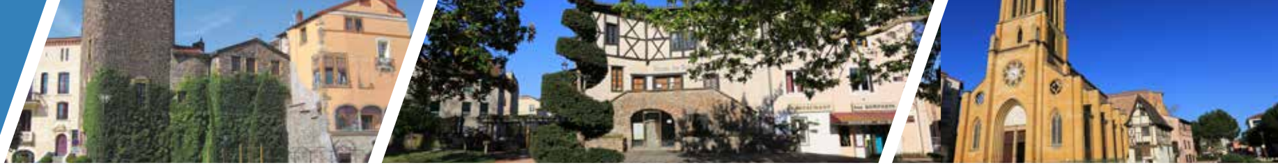
Le centre ancien avec l'Office de Tourisme, la maison des métiers d'art et l'église Saint-Etienne