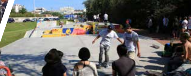
Nauticum de Roanne, patinoire et skatepark