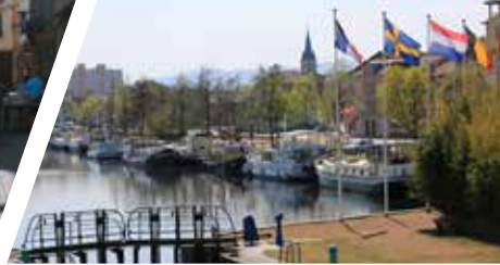
Place Maréchal de Lattre de Tassigny, place du marché et place des promenades