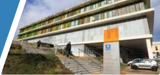
Centre hospitalier de Roanne